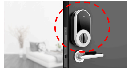
<NinjaLock 取り付けイメージ>

ライナフの「NinjaLock」は、玄関扉のサムターンに取り付けることにより、スマートフォン等で鍵の開閉が可能となるIoTデバイスです。