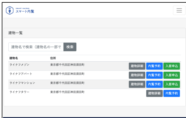
<スマート内覧/部屋一覧>