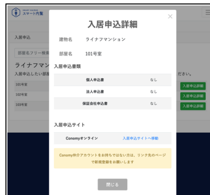
<スマート内覧/入居申込選択後>